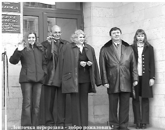
Ленточка перерезана - добро пожаловать!

На торжественной церемонии открытия и в беседе с тележурналистами студенты наперебой говорили о том, что им очень повезло: они теперь не только учатся в одном из лучших технических университетов Санкт-Петербурга, но и жить будут в прекрасных условиях. Ребята получили в подарок не просто общежитие, а уютный благоустроенный дом, в котором земляки смогут жить вместе. Еще один маленький уголок далекого Сибирского Югорска появился теперь на Торжковской улице!