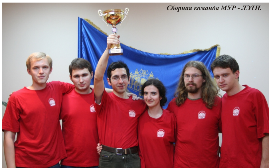
Сборная команда МУР - ЛЭТИ.

10 - 12 ноября 2006 года в г. Петергофе прошли игры II Кубка Европы среди студентов по интеллектуальным играм. В соревнованиях выступали 28 лучших студенческих команд из европейских стран. В том числе, 4 команды представляли Санкт-Петербург. В течение 3-х дней знатоки участвовали в турнирах «Что? Где? Когда?» и «Брэйн-ринг», а также в дополнительной игровой программе.