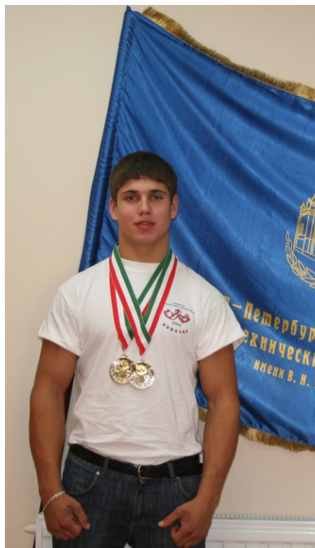
Трехкратный чемпион Европы Виталий Калмыков

18 ноября 2006 г. в нашем университете состоялся Пятый Чемпионат вузов Санкт-Петербурга по армспорту. Этот молодой и развивающийся вид спорта сегодня особенно популярен среди студентов. В прошлом году Чемпионат проходил в Санкт-Петербургском государственном университете кино и телевидения. Наш вуз принимал участников Чемпионата впервые. И впервые на Чемпионате было столь солидное представительство: 25 вузовских команд (154 юноши и даже