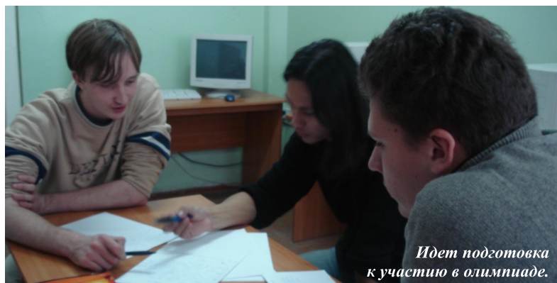
Идет подготовка к участию в олимпиаде.

Поздравляем олимпийцев и ждем новых побед!