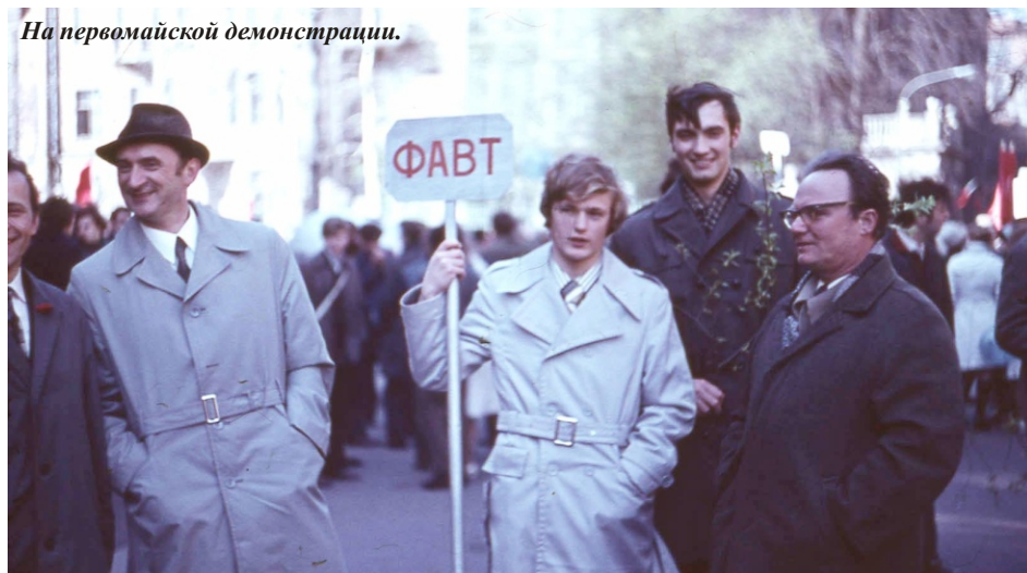
На первомайской демонстрации.

дома - сами полуголодные и замерзшие, в условиях блокадного города-героя.