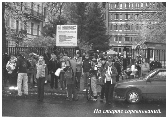
На старте соревнований.

Основную массу участников «Бегущего Города», как и в прошлые годы