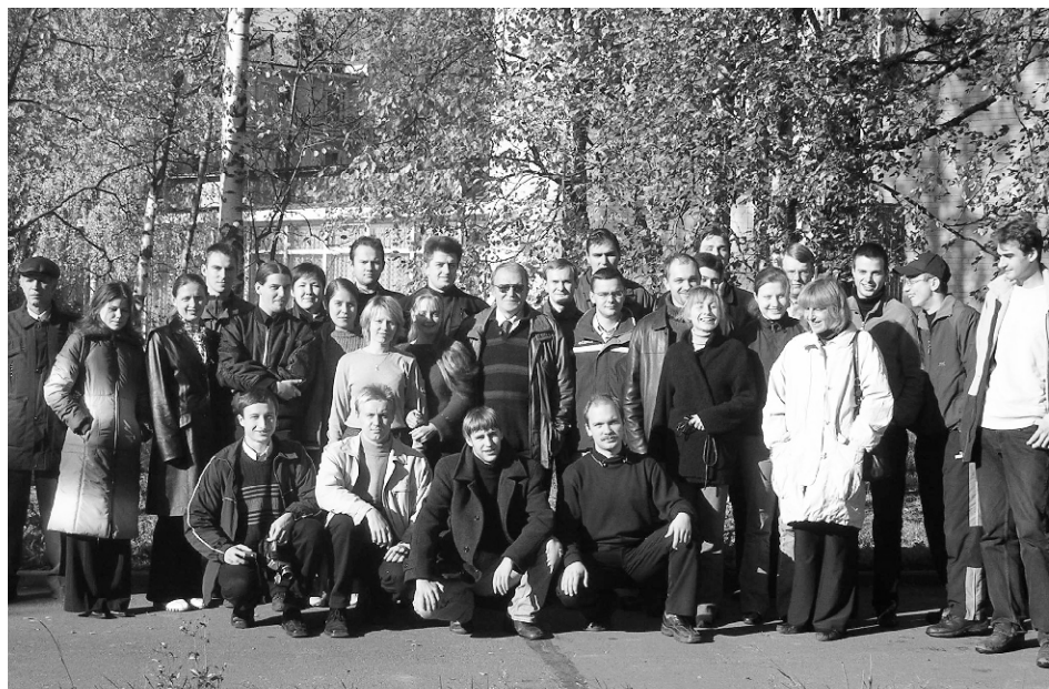
Участники 7-й молодежной школы в п. Репино.

С каждым годом расширяется круг участников школы. В этом году выступили с докладами молодые исследователи - студенты ФЭЛ, ФЭА и ФКТИ, а также гости из Новгородского государственного университета им. Ярослава Мудрого, Тульского государственного педагогического университета им. Л. Н. Толстого, Ярославского государственного университета им. П. Г. Демидова, ФТИ им. А.Ф. Иоффе РАН, ИХС