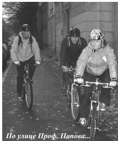
По улице Проф. Попова...

Церемония подведения итогов и награждения победителей прошла в ЛЭТИ 29 октября.