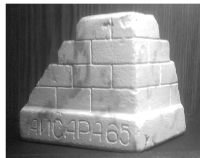
Сувенир от "ВАкс и инвалиды"

Во второй половине августа в отряд приехала делегация руководителей молодежных организаций из Югославии, чтобы познакомиться, как работают советские студенты на целине. Югославы работали вместе с нами и говорили, что наш труд довольно тяжел. Мы же улы-