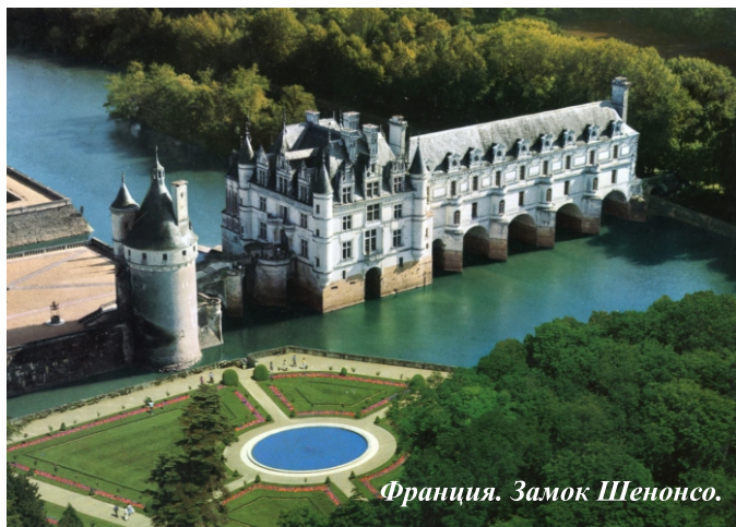
Франция. Замок Шенонсо.