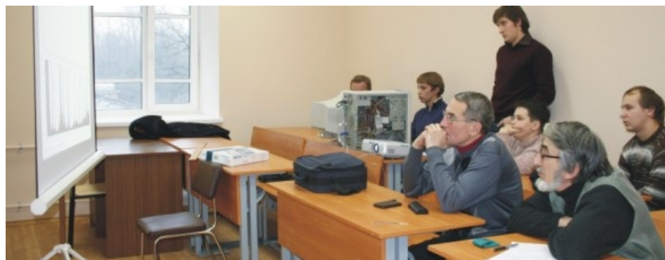
На секции “Информационные технологии проектирования радиоэлектронных средств”