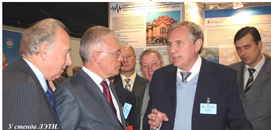
У стенда ЛЭТИ.

Участие нашего университета в мероприятиях было отмечено дипломом оргкомитета XII Международного промышленного Форума "Российский промышленник-2008".